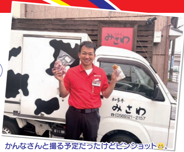
かんなさんと撮る予定だったがピンシヨット!