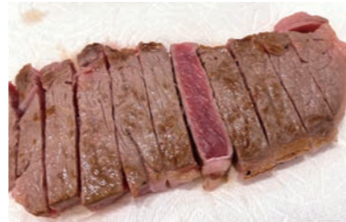
みさわさんの美味しいステーキをお肉ご飯にします。