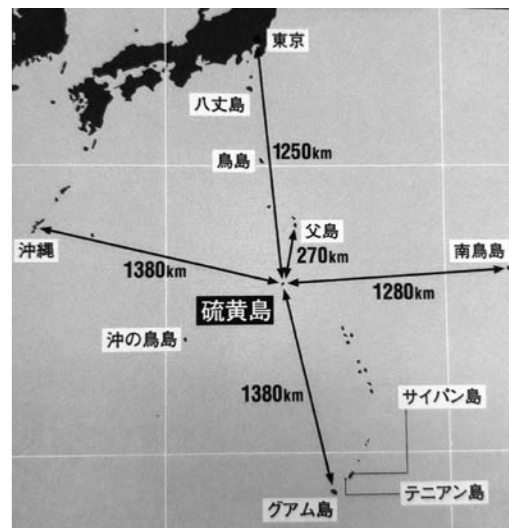
図1 サイパン・テニアン・グアム陥落で本土への空襲が始まり、硫黄島陥落で空襲が倍以上になった。この地図を見ると理由が分かる。引用「硫黄島栗林忠道大将の戦訓」