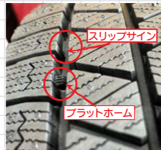
スリップサインとプラットホーム

スリップサインはよく言われる、車検に通るか基準と言われている残溝1.6mmにあるサインです。スタッドレスタイヤには、スリップサインとは別にプラットホームと言われる、スタッドレスとしての機能を果たせる限度値のサインがあります。知らない方も多いと思いますが、とても重要なサインのプラットホーム。スタッドレスをせっかく装着していても、機能を果たさないとかなり危険です。一度、プラットホームはまだ出てないか、スタッドレスがどうゆう状態か、私たちと一緒にぜひ確認しましょう。