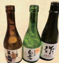
知多半島のお酒です

一番美味しいと思っています。海の幸に恵まれミカンや野菜も美味しくその上お酒が最高に美味しいと本当に恵まれた地区と思います。先日東京から知人が来て私の中学時代の同級生が営んでいる浜潮さんにて会食しました。その知人がアワビに海老さしみなど絶賛してくれました。また半田に知多半島の冷酒を色々たしなみました。まずは国盛の「半田郷」に阿久比の丸一酒造「ほしすみ」常滑の。澤田酒造の「白老」と本当に皆が色々冷酒も飲んだけど知多半島のお酒はみな飲みやすい美味しいと