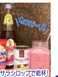
サラシロップで乾杯!