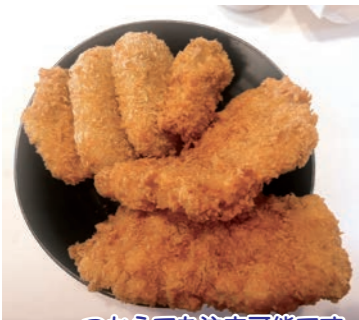
一つからでも注文可能です。揚げたてで美味しい。