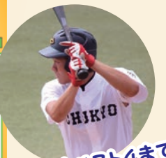
大学ではベスト4まで行きました!!