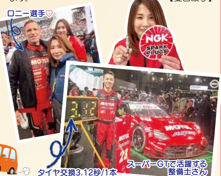
スーパーGTで活躍する整備士さん