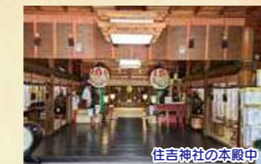
住吉神社の本殿中

私は大切な役割を頂き、1月の中旬から神社の本殿にて宮司さんから祈年祭の流れに献幣使の作法を教わりました。左足から歩き頭を下げる角度に祭詞の読み上げる速さや拍手の際は左手が右手より上に合わせる本殿から帰る際は右足からなど本当に作法を覚えるのは大変でした。当日は朝早くから献幣使の衣装を着て神主さん宮司さん巫女さんに雅楽を奏でる方々に神社関係者などが大勢集まり行われました。