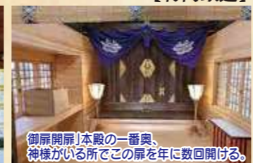
御扉開扉|本殿の一番奥、神様がいらっしゃる所でこの扉を年に数回開ける。