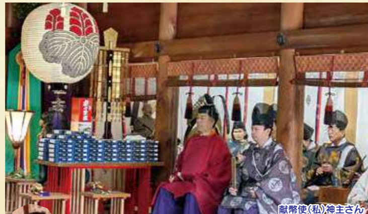
献幣使(私)神主さん

そんな寒い2月11日(祝)に住吉神社祈年祭の献幣使を務めさせて頂きました。「祈年祭」とは「かねんさい」や「としごいのまつり」と読まれ、その年の穀物に対する災いを防ぐとともに五穀豊穡や平安を祈ることを主な目的とするもので「献幣使」は神社本庁から各神社に幣帛を奉獻するための天皇の使いでもあります。