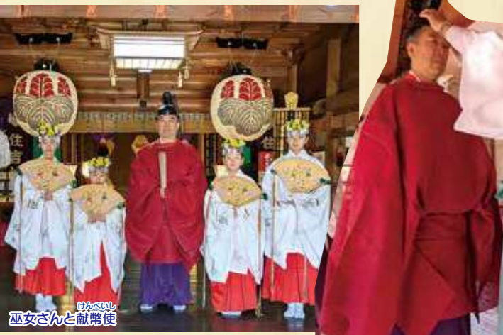
巫女さんと献幣使