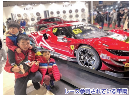
レース参戦されている車両