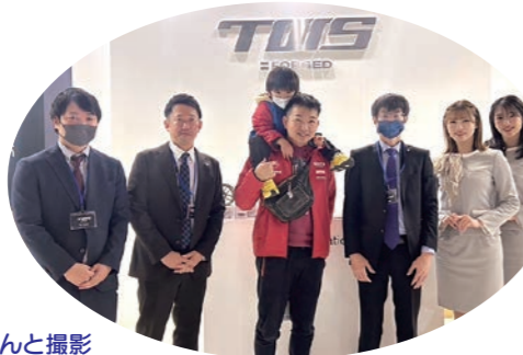
スタッフさんと撮影

今回こちらがメインだったのですが、今年86.BRZの住吉タイヤ専売サイズのホイールを作成します。TWSWHEEL T66Fと言う種類で16インチで超軽量になります。詳しくは、スタッフにご相談ください。完成は8月・9月頃です。