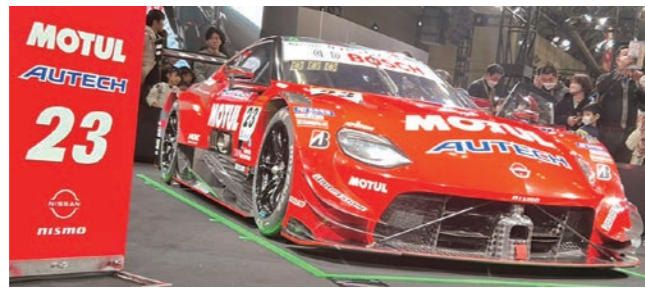
モチュールZ #23号車2024年参戦車両

ニスモブースは、スーパーGTで大活躍したモチュールZ#23号車の展示と、タイヤ交換の実演を間近でしてくれました。モチュールオイルは住吉タイヤのメインのオイルなので応援している車両です。実演でタイヤ交換のタイムが1本3.12秒ととても早く、ファンとしては面白かったです。(取付ナットはセンターロック式)1本22キロのタイヤと、スーパーGTで使っているセンターロックのインパクトを触らせてもらえました。インパクトは1個100万円以上するそうです。