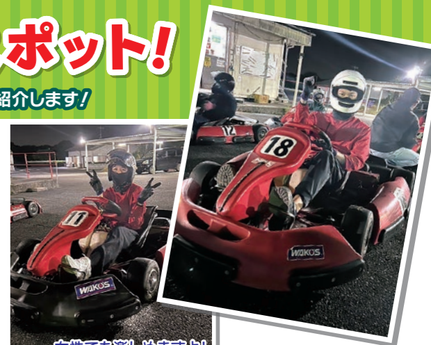
女性でも楽しめますよ!