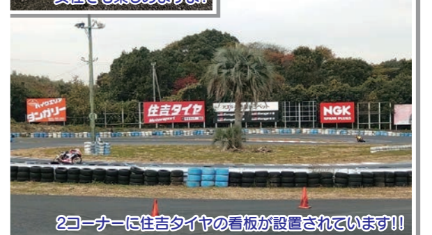
2コーナーに住吉タイヤの看板が設置されています!!