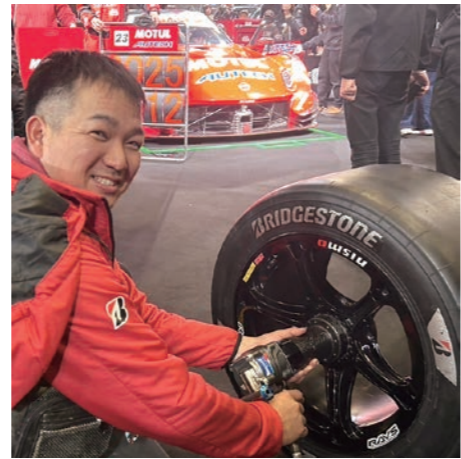
実際に使っている、インパクトレンチとタイヤを触らせて頂きました!