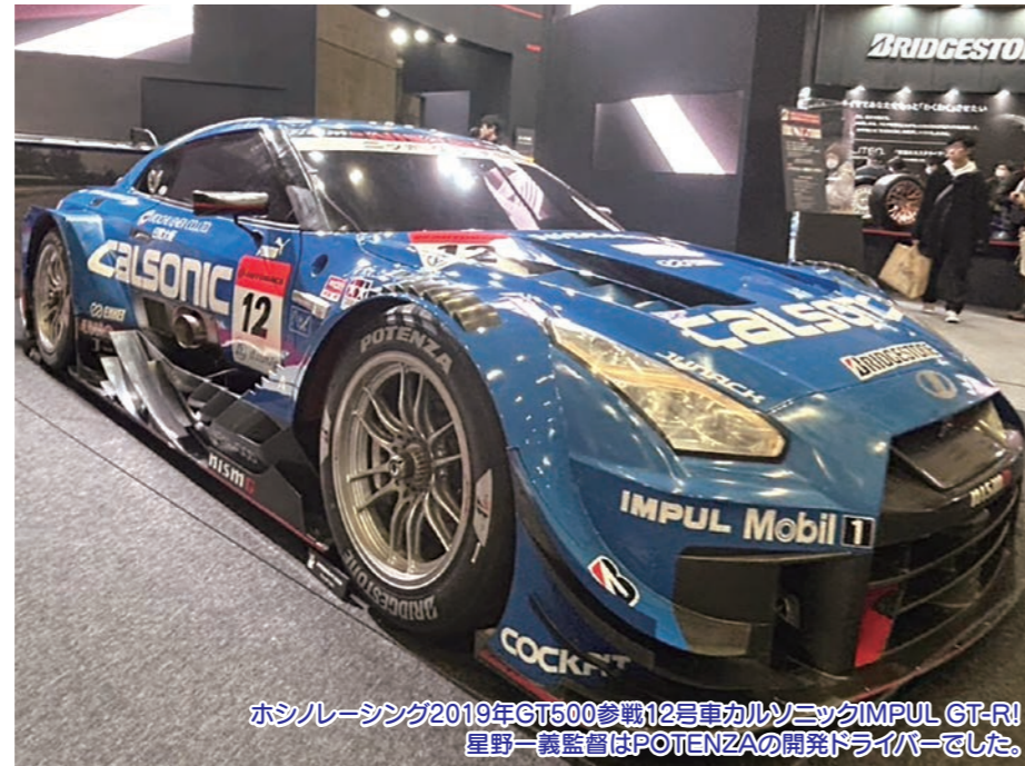
ホシノレーシング2019年GT500参戦12号車カルソニックIMPUL GT-R! 星野一義監督はPOTENZAの開発ドライバーでした。

スーパーGTやスーパー耐久で使用されている車両を見る事が出来ました。タイヤも歴代のシリーズが展示してあり、モータースポーツに大きな貢献してきた事がよく分かる展示でした。実はポルシェの新車装着タイヤに初めてアジア勢のタイヤメーカーで採用されたのは、ブリヂストンのPOTENZAでした(1985年)。その後フェラーリにも新車装着として採用されたと言う歴史があります。世界で初めてアジアのタイヤが認められた瞬間でした。