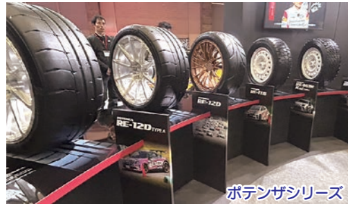
ポテンザシリーズ